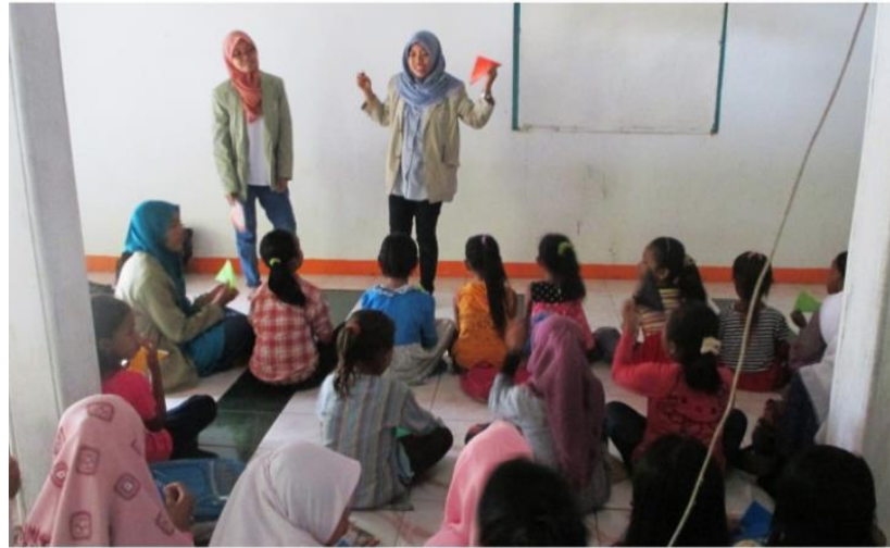
Gambar 2.3 Kegiatan PKM