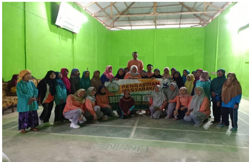
Gambar 2.4 Selesai Kegiatan PKM