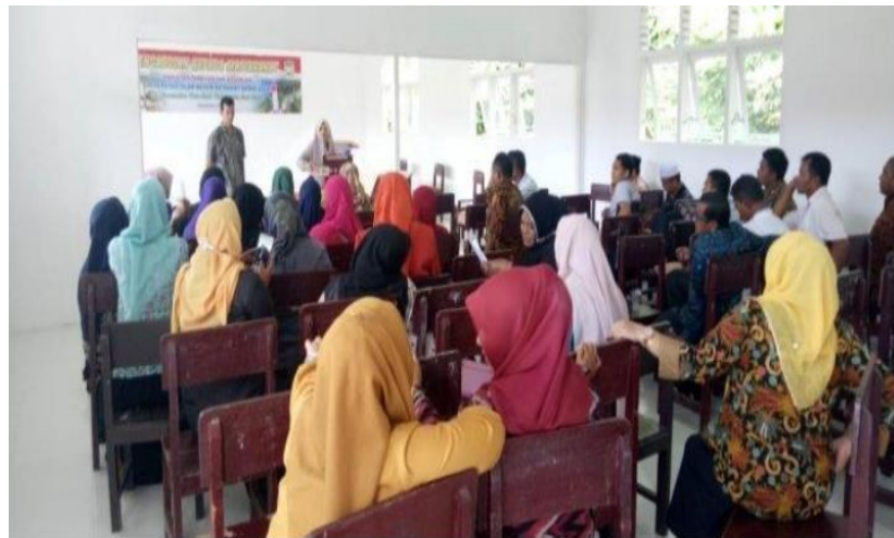
Gambar 2.2 Foto Kegiatan PKM

Metode pelaksanaan dalam kegiatan ini dilaksanakan pada tanggal 4 November 2021 di Aula puskesmas depati VII ". Pelaksanaan dan pelatihan singkat ditujukan pada masyarakat dengan gastritis yang belum tahu cara mengatasi gastritis . Media dan alat yang disediakan berupa leaflet. Metode yang digunakan adalah penyuluhan, tanya jawab atau evaluasi. Berikut gambar pelaksanaan kegiatan :